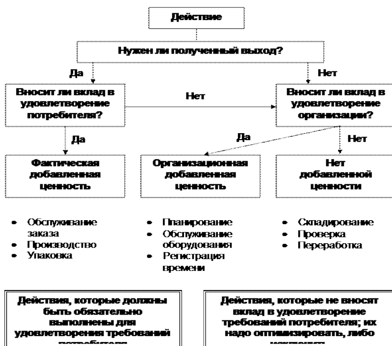
Рисунок 1 - Методика анализ добавленной ценности