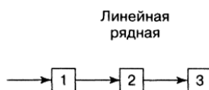
Рисунок 1 - Линейная структура перемещения

Например, на участках с линейной пространственной структурой (рис. 3) предметы труда идут по ходу технологического процесса. Предмет труда проходит все позиции, которые специализированы на отдельных работах или их наборе. В цехе при этом могут быть две-три поточные линии (прямоточные или непрерывные), причем ремонтирующие различные серии ПС.