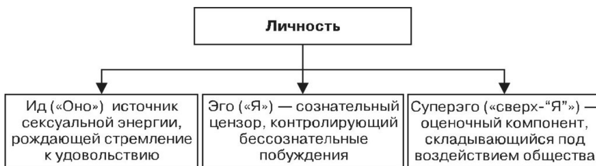
Схема 4.6. Структура личности по З. Фрейду

Фрейд очертил следующую структуру личности: (см. схему)