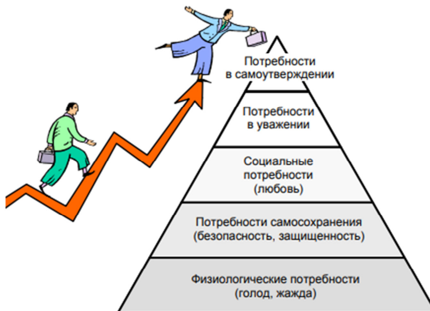
Рисунок 2 - Иерархия потребностей по Маслоу

Возьмем, для примера, известную иерархию потребностей, предложенную Авраамом Маслоу (рис. 2). Очевидно, что данная иерархия решает задачу систематизации потребностей человека потребности сгруппированы и проранжированы с точки зрения их важности.