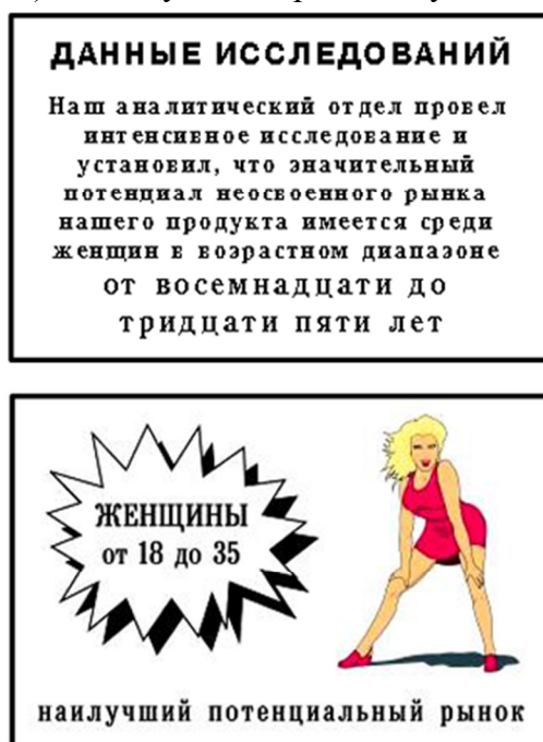
Рис. 3. Примеры неудачного и удачного оформления иллюстративного материала (но не для защиты диссертации)

- светлые и бледные элементы визуализированного сообщения лучше смотрятся в верхней части плаката, а темные – в нижней; - использование холодных цветов (синего, голубого, синезеленого) действует на зрителей успокаивающие;