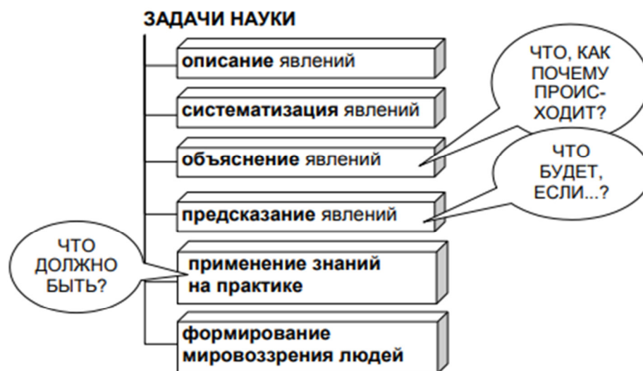
Рисунок 1- Задачи науки

Как видно из приведённого списка задач, основными функциями науки являются объясняющая, предсказывающая и мировоззренческая функции. Объясняющая функция позволяет понять, как устроен мир, почему происходят те или иные явления. Предсказывающая функция позволяет отвечать на вопросы типа "Что будет если ...?"