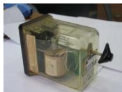
Реле типа ИВГ