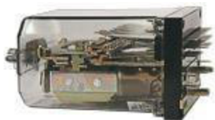
Реле типа РЭЛ