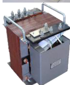
Преобразователь частоты ПП 50/25