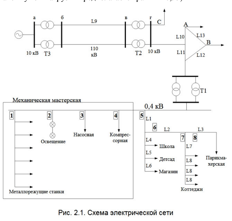
Рис. 2.1. Схема электрической сети

2. Выбрать сечения кабелей разветвленной сети L1–L8 с односторонним питанием по допустимой потере напряжения, равной 5%, проверить выбранные кабели по допустимому току нагрева.