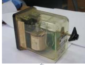
Реле типа ИВГ