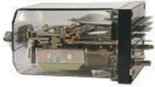
Реле типа РЭЛ