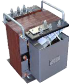
Преобразователь частоты ПП 50/25