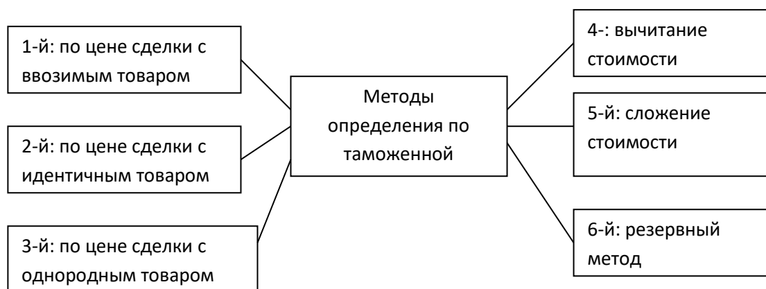
Рисунок 3 - Методы определения таможенной стоимости товаров

Определение таможенной стоимости товаров происходит с помощью одного из методов (рис. 3).