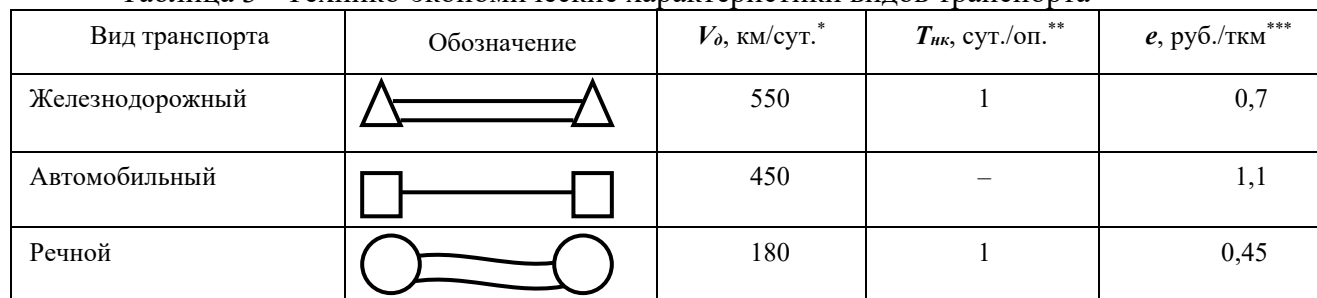
Таблица 3 - Техничко-экономические характеристики видов транспорта

* V_{\partial} – скорость доставки грузов;