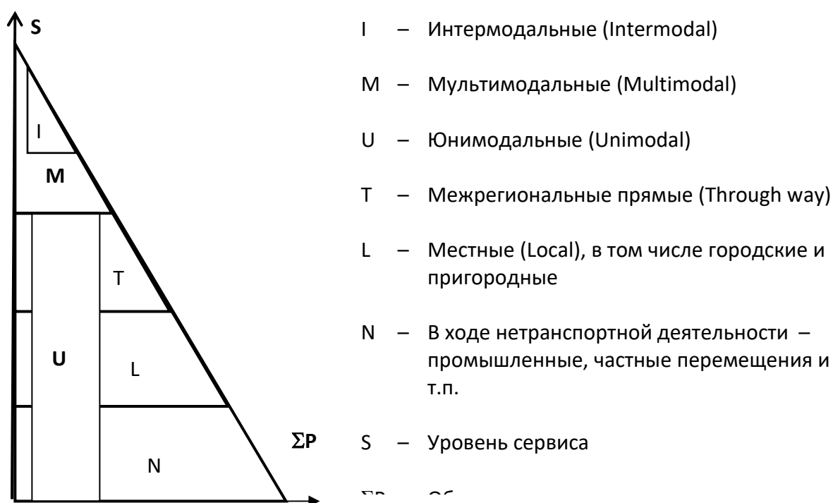
Рисунок 1 Иерархическая структура систем доставки

Отдельно выделим такую категорию мультимодальных перевозок, как интермодальные – системы доставки грузов и пассажиров в международном сообщении несколькими видами транспорта по единому перевозочному (проездному) документу в единой перевозочной единице (или транспортном средстве). Такая технология предполагает наиболее высокий уровень транспортного обслуживания с минимальным участием потребителей в ее осуществлении.