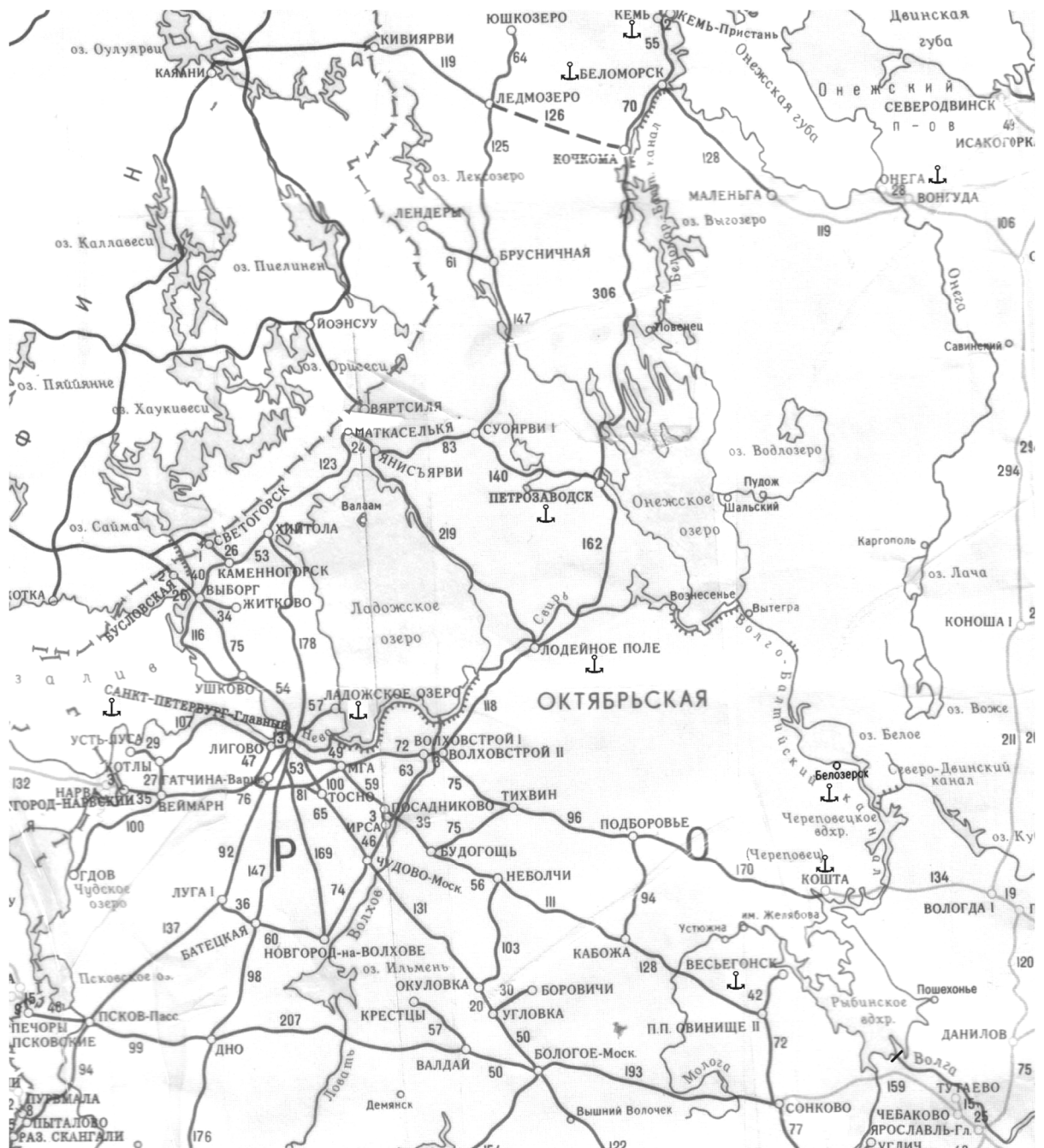
Рисунок 3. Фрагмент схемы железных дорог

Сеть автомобильных дорог приближенно считать совпадающей с сетью железных дорог (от Белозерска до Череповца – вдоль канала). Расстояние между речными портами оценивать ориентировочно с учетом масштаба представленной схемы.