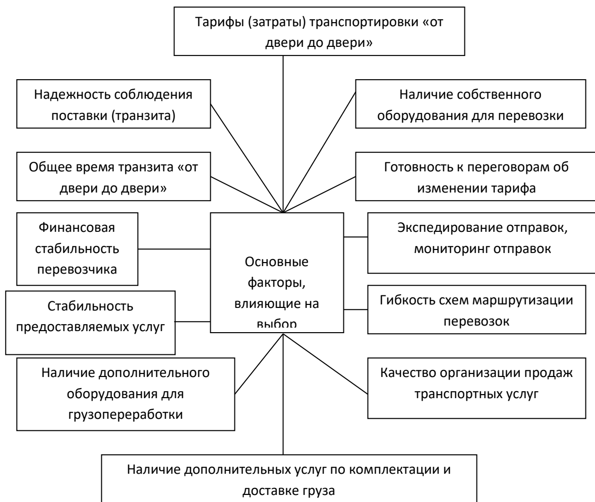
Рисунок 1 - Факторы, влияющие на выбор перевозчика

Перевозчики могут оцениваться по трехбалльной шкале: 3 – полностью удовлетворяют логистическим требованиям; 2 – частично удовлетворяют; 1 – не соответствуют требованиям.