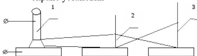
Штатив для закрепления электрода Проекционная линза Экран