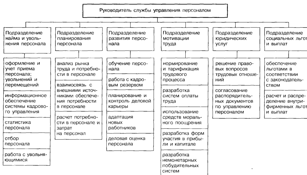
Рисунок 2 - Схема оргструктуры службы управления персоналом

Выбрав определенный вариант по табл. 1, необходимо рассчитать численность специалистов по управлению персоналом исходя из общей численности персонала организации. Затем общую численность службы управления персоналом следует распределить по ее подразделениям согласно варианту, выбранному по табл. 2