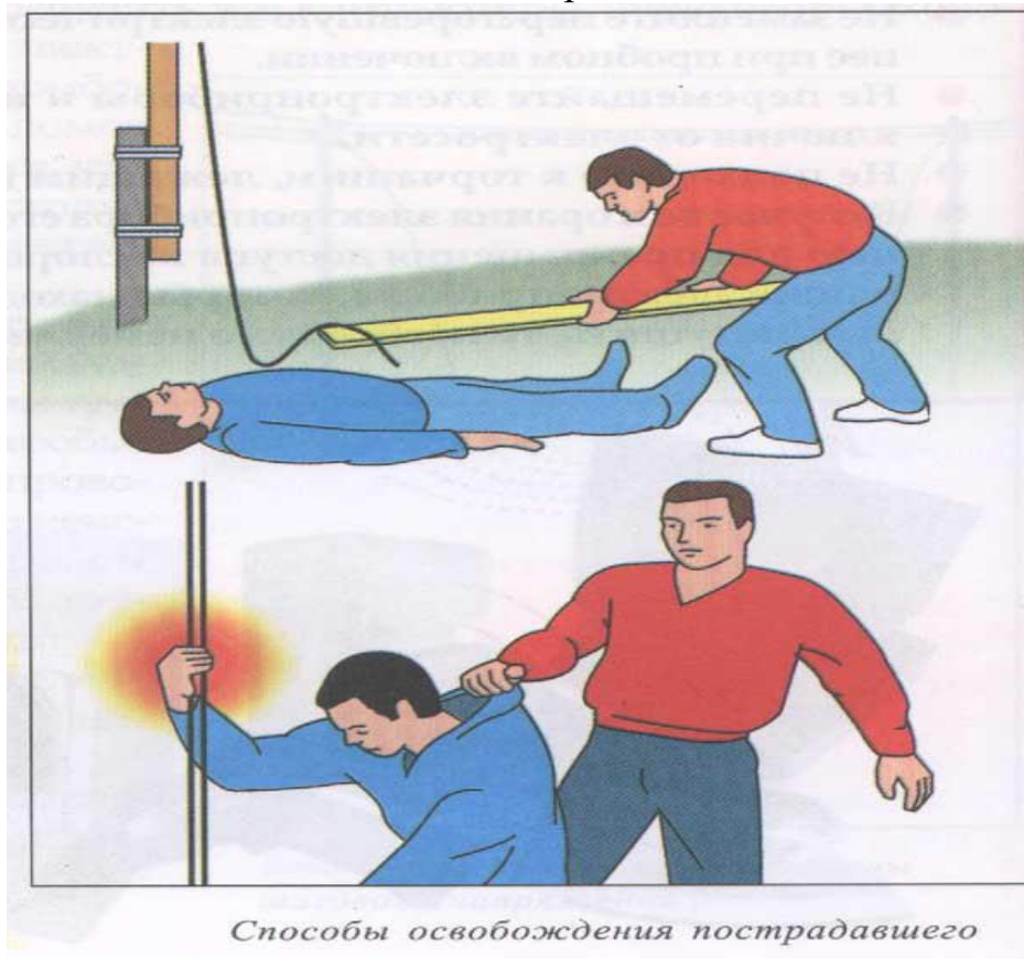
Способы освобождения пострадавшего

Если человек, пораженный током, соприкасается с токоведущими частями, необходимо быстро освободить его от действия тока, принимая одновременно меры предосторожности, чтобы самому не оказаться в контакте с токоведущими частями или с телом пострадавшего, а также под напряжением шага.