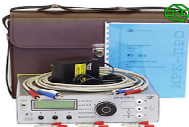
Рисунок 3. 1 – Комплектность прибора ИРК-ПРО