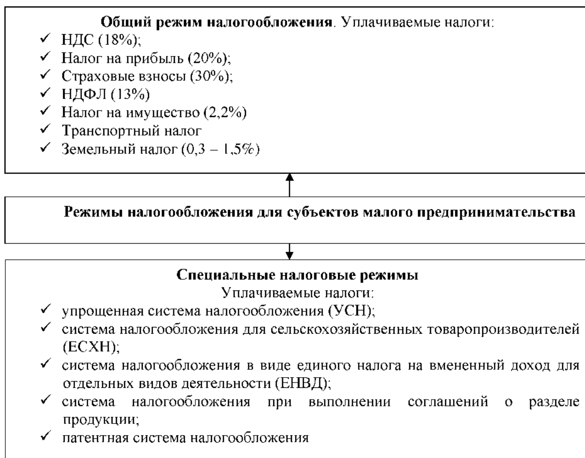
Рисунок 1- Режимы налогообложения для субъектов малого предпринимательства

Объектом налогообложения при исчислении ЕСН признаются выплаты и иные вознаграждения, исчисляемые налогоплательщиком в пользу физических лиц по трудовым и гражданско - правовым договорам по выполнению работ, оказанию услуг и авторским договорам.